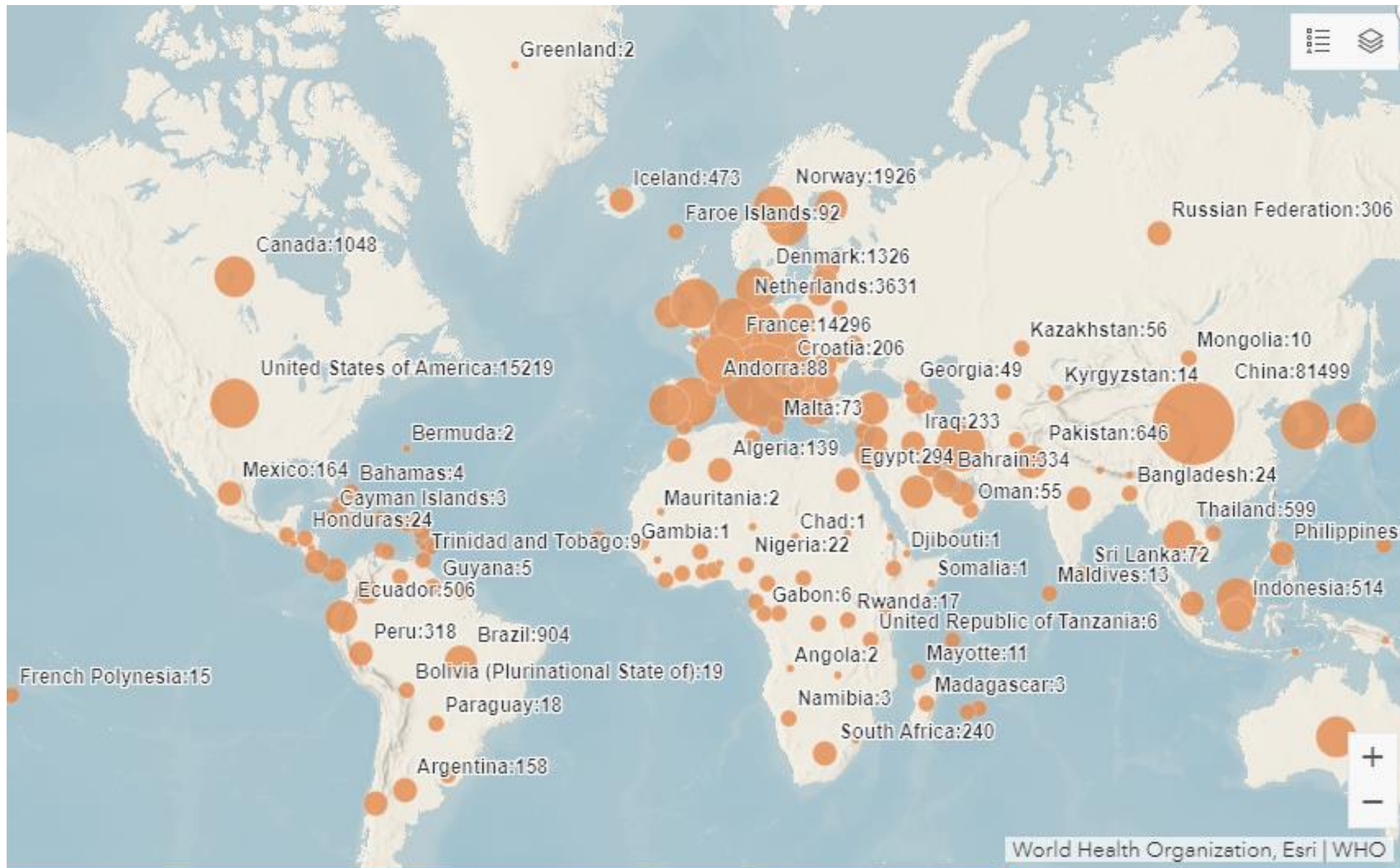
Crescimento dos casos dia a dia (Fevereiro/Março 2020)

Até a data de 22 de março de 2020, segundo dados da Organização Mundial da Saúde, 186 países e territórios já haviam sido atingidos pelo vírus COVID - 19. No mesmo período, o número de contaminados continuava subindo rapidamente, com de 332 mil casos e mais de 14 mil mortos.